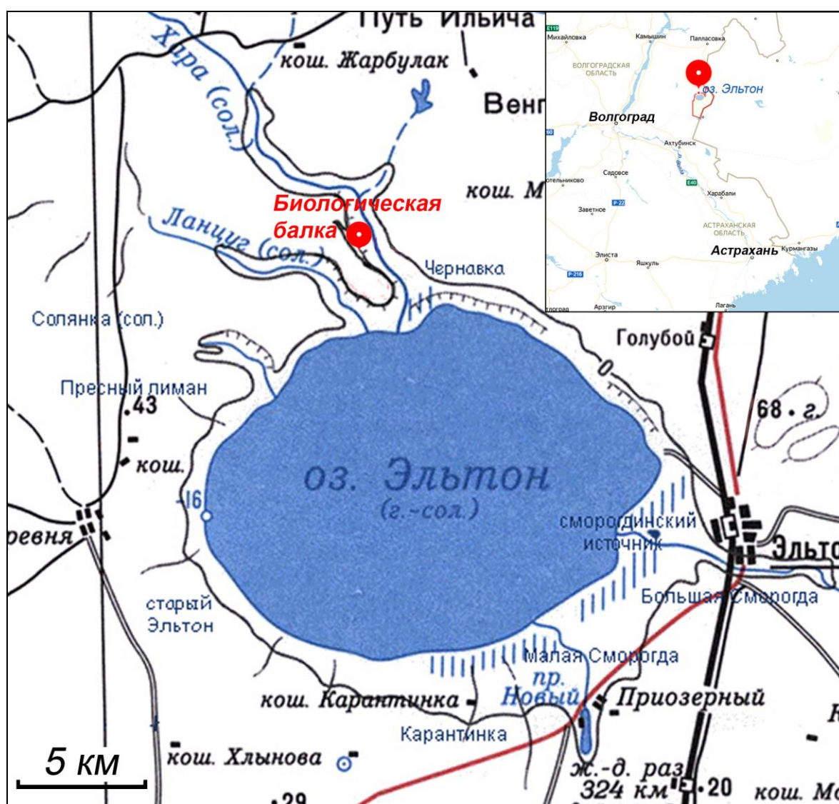
Рис. 1. Район проведения исследований. Fig. 1. Research area.

дренированных участках мощностью до 2 м еще в начале XIX в. произрастали разреженные и низкостелетные байрачные леса с участием ветлы ( Salix alba ), осокоря ( Populus nigra ), тополя белого ( P. alba ), осины ( P. tremula ), яблони ранней ( Malus praecox ) и других пород (Динесман, 1955, 1958, 1960). Ныне на их месте сформировались полидоминантные кустарниковые заросли байрачного типа из жостера слабительного ( Rhamnus cathartica ), терна ( Prunus spinosa ), жимолости татарской ( Lonicera tatarica ), шиповника ( Rosa canina ), иногда с единичными экземплярами яблони, дикой груши ( Pyrus communis ), с примесью ежевики ( Rubus caesius ) и крайне редко – с бересклетом бородавчатым ( Euonymus verrucosa ). Снаружи байрачные насаждения обычно окаймлены миндалем низким ( Amygdalus nana ) и шиповником ( Rosa canina ; Динесман, 1960; Быков, Бухарева, 2016).